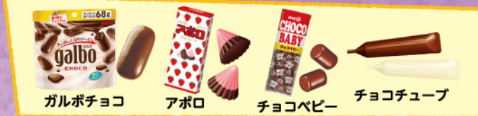
ガルボチョコ アポロ チョコベビー チョコチューブ