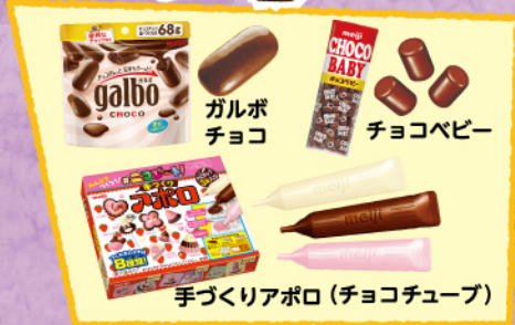
ガルボチョコ チョコペビー