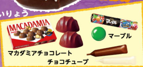
マカダミアチョコレート チョコチューブ