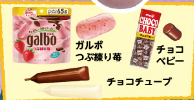
ガルボつぶ練り苺 チョコペビー チョコチューブ