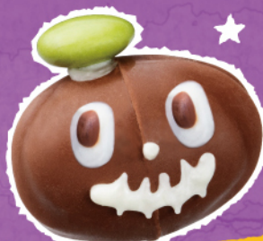
かぼちゃのおばけ